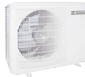
Buitenunit lucht/water warmtepomp