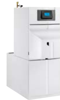
Remeha Lava Plus S E op boilermodule BS 160 ESL