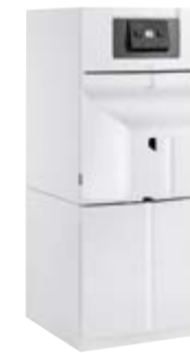
Remeha Lava Plus D op boilermodule BS 110 ESL

In elke verwarmingsketel module wordt een eenvoudig bedieningsbord (D-Control) of geavanceerde regelaar met verlicht display (S-Control) naar keuze geplaatst. Door een optionele buitenvoeler bij te installeren wordt 5% extra bespaart op uw energiefactuur. Met de Remeha iSense (met draad of draadloos) of qSense (draadgebonden) bediening wordt de installatie op elk moment van de dag vanuit uw woonkamer correct geregeld. Deze modulerende thermostaten maken van de Remeha Lava Plus een zuinige stookolieketel.