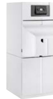
Remeha Hera Condens D op boilermodule BS 110 ESL

*Neem contact op met uw Remeha installateur. Hij gidst u graag naar een systeem op maat van uw behoeften.